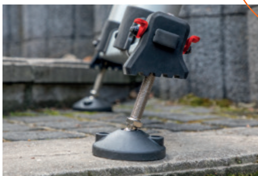
Mit den roten Hebeln wird der Höhenausgleich stufenlos verschoben. Die Feinjustierung kann wenn nötig mittels Schraubrotation vorgenommen werden. Kugelgelenke ermöglichen den korrekten Anstellwinkel und gleichen Bodenunebenheiten aus.