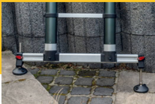
Teleskopeiste ausgefahren und mit Höhen- ausgleich versehen – bereit für den Einsatz