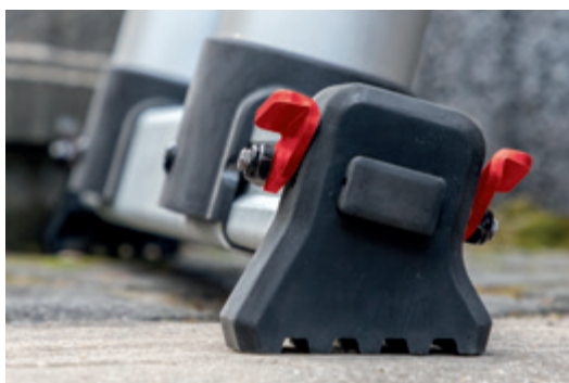
Auch ohne Höhenausgleich ist die Anlegeleiter standfest mit rutsicherem, winkelig gearbeitetem Standfuß.