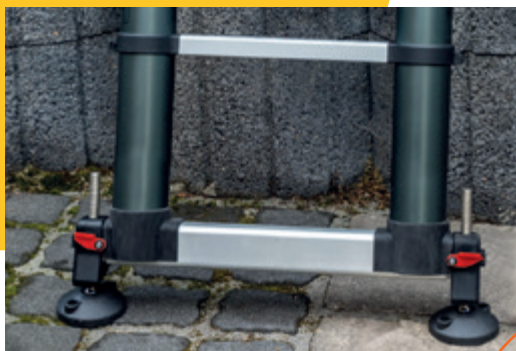
Teleskopeiste eingeschoben – fertig zum Transport